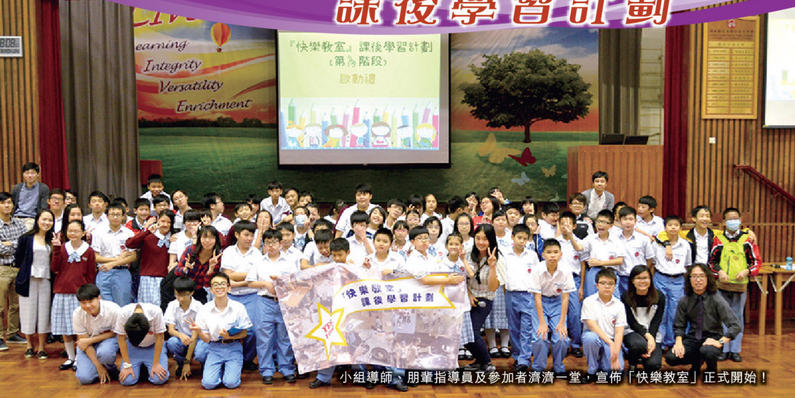
小組導師、朋輩指導員及參加者濟濟一堂，宣佈「快樂教室」正式開始！

「快樂教室」課後學習計劃(第一階段)已於十月至十二月期間舉行，每星期舉辦三次活動，共有59名中一至中二級學生參加，另外有17位中三至中四級朋輩指導員協助。計劃期望提供一個讓學生愉快學習的平台，結合功課輔導及活動的元素，使同學體會學習的樂趣，從而提升其學習動機、自信心及溝通能力。我們以「YES, I CAN!」（「我信，我做到！」）作為今年「快樂教室」的口號，希望同學可以從活動中了解自己的長處，發揮潛能，在不同層面上有所提升，繼而相信自己有能力達至最佳表現。除了恆常的活動外，本年度「快樂教室」於計劃開展前後分別有啟動禮及頒獎禮，使計劃更加完整。