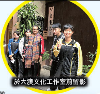
於大澳文化工作室前留影

歷史科是次以「大澳文物保育」作為主題，讓修讀歷史科的中四同學親身接觸棚屋、舊大澳警署（現為三級歷史建築的大澳文物酒店）及楊侯古廟（一級歷史建築），讓同學反思該等建築或文物與該地的發展關係及存在價值。同時引起學生反思大澳在面對城市化及年青人城鄉遷移的威脅下，於2011年被列為國家級非物質文化遺產的大澳端午龍舟涌所面對的傳承的挑戰。