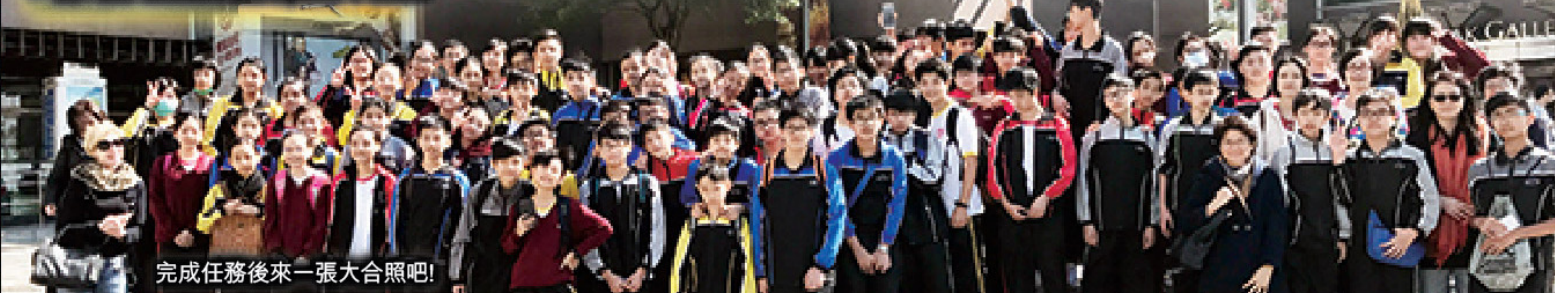
完成任務後來一張大合照吧!