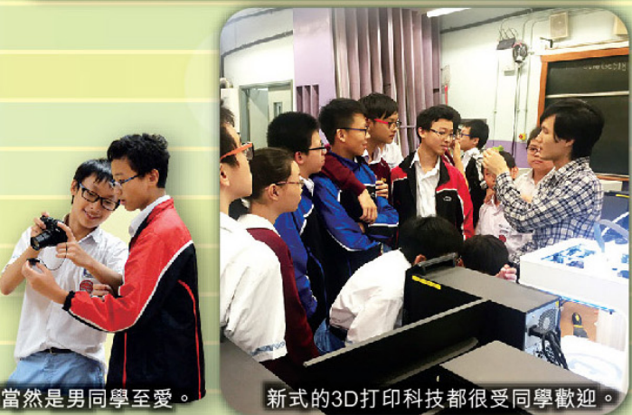
攝影班當然是男同學至愛。