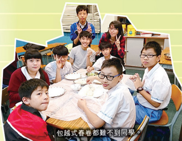
包越式春卷都難不到同學。

在內容設計上，「快樂教室」有別於一般的功課輔導班，而是「學」與「樂」並重，每天的活動分為兩部分，前半部分為功課輔導或學習小組，而後半部分為主題活動。功課輔導及學習小組由輔導員、支援人員、外聘導師及朋輩指導員負責，主要協助同學解決功課上的疑難或教授一些學習方法，讓同學掌握不同的學習技巧。過程中同學都表現認真