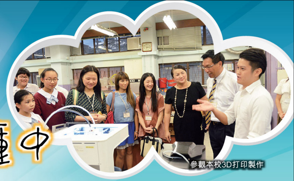
參觀本校3D打印製作