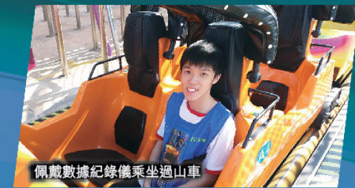
佩戴數據紀錄儀乘坐過山車

● 通過這次的物理科專題研習日，我們可以活學活用，把課堂的知識融入生活。還可以用輕鬆的方式讓同學更了解學習的內容。總括而言，我覺得這樣的活動對同學的學習是有幫助的。