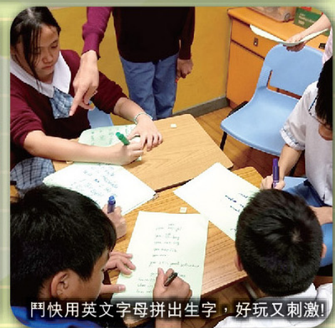
鬥快用英文字母拼出生字，好玩又刺激！