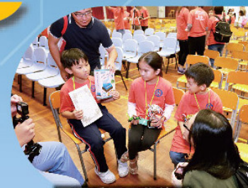
冠亞季軍同學接受 記者訪問