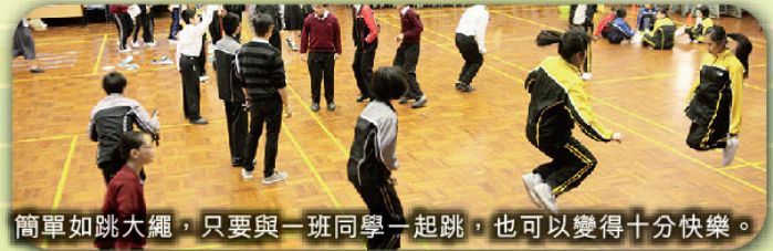
簡單如跳大繩，只要與一班同學一起跳，也可以變得十分快樂。

經過一個學期的「快樂教室」，不論參加者或朋輩指導員在學習及個人成長方面均有很大得著。他們的努力成果得到朋輩及導師的肯定，期望同學能夠繼續努力，突破自己！