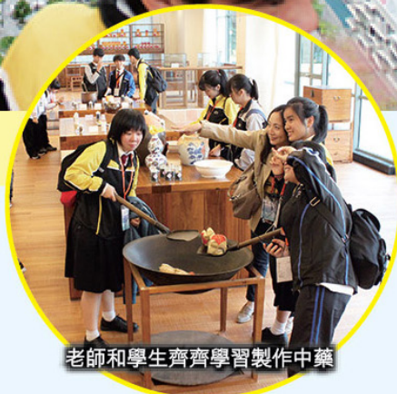
老師和學生齊齊學習製作中藥

行程包括:參觀訪問南沙科技園規劃館、南沙鶴年堂、中醫城海展示廳、前海青年夢工場等。