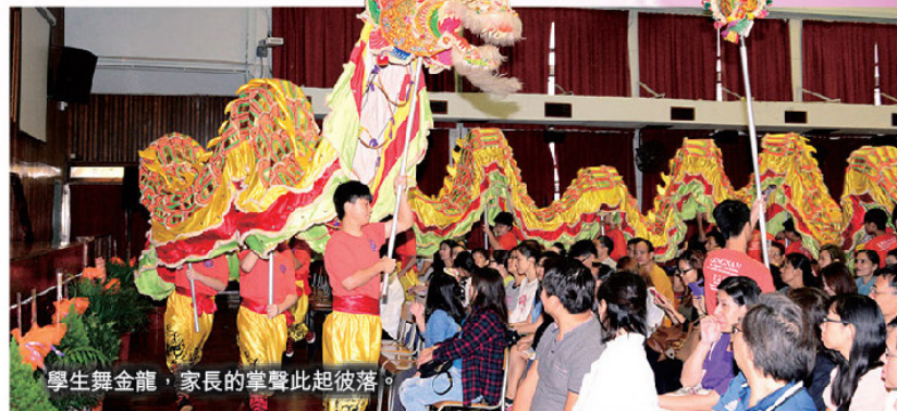
學生舞金龍，家長的掌聲此起彼落。

本校於十一月十九日及二十日舉行第二屆「開放日暨小六升中模擬面試」。活動分三個部分：禮堂表演、校內參觀和模擬面試。兩天共有近二百位家長參加禮堂活動，節目包括：校長向家長分享選校須知；老師講解面試技巧；學生舞金龍、魔術表演和英語音樂劇。節目精彩之餘，環環緊扣，絕無冷場。家長的掌聲此起彼落，禮堂充滿歡樂氣氛。家長均十分滿意是次表演活動，更有