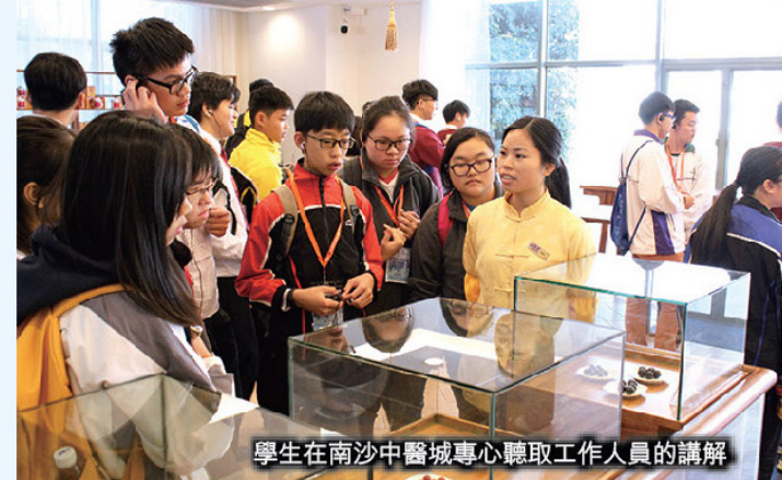
學生在南沙中醫城專心聽取工作人員的講解

參觀南沙規劃館，讓我了解南沙規劃的概念，例如：高端製造、金融業務平行、入駐金融企業、國際商貿等等概念。考察前海展示廳，讓我了解前海的發展規模，亦明白中國夢工場可以讓青少年有更好的發展空間和優質待遇。此次考察，令我對南沙和前海有所認識及了解，知道他們的未來經濟發展有良好的趨勢。