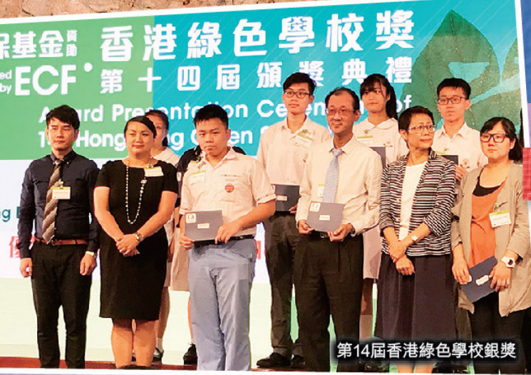
第14屆香港綠色學校銀獎