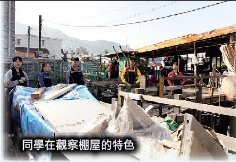
同學在觀察棚屋的特色