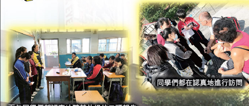
下午同學們都認真地聽其他組的口頭報告

本年度英文科在香港著名的旅遊景點太平山頂進行專題研習活動，同學都懷著興奮雀躍的心情向目的地出發。到達山頂後，同學們都自覺地與組員在山頂四處尋找手上任務的答案，亦順利邀請到不同國籍的旅客進行訪問。下午回校分享他們的訪問結果和得著。是次活動同學們不但能嘗試自行設計訪問題目，更能實踐在學校學到的英語會話技巧，使英語學習不再只是紙上談兵。