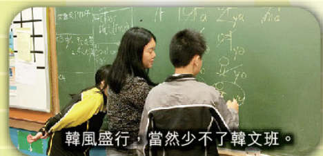
韓風盛行，當然少不了韓文班。