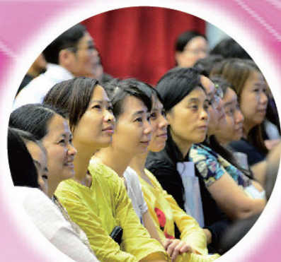
校長向家長們分享升中選校須知，大家都專注地聆聽。

本校於十一月十九日及二十日舉行第二屆「開放日暨小六升中模擬面試」。活動分三個部分：禮堂表演、校內參觀和模擬面試。兩天共有近二百位家長參加禮堂活動，節目包括：校長向家長分享選校須知；老師講解面試技巧；學生舞金龍、魔術表演和英語音樂劇。節目精彩之餘，環環緊扣，絕無冷場。家長的掌聲此起彼落，禮堂充滿歡樂氣氛。家長均十分滿意是次表演活動，更有