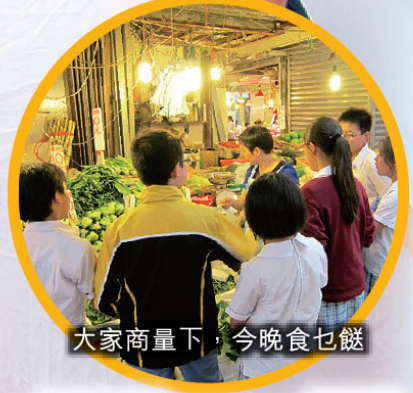
大家商量下，今晚食乜餸