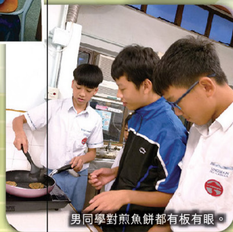
男同學對煎魚餅都有板有眼。