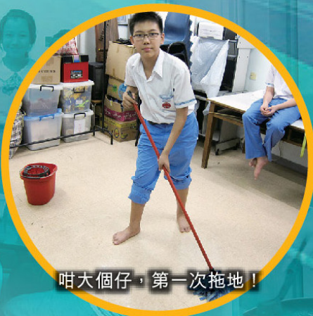
咁大個仔，第一次拖地！