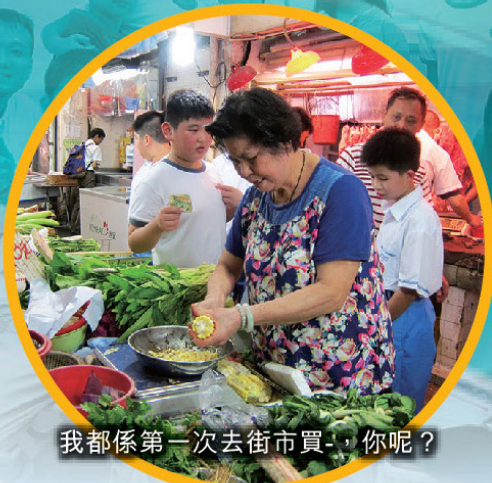
我都係第一次去街市買，你呢？