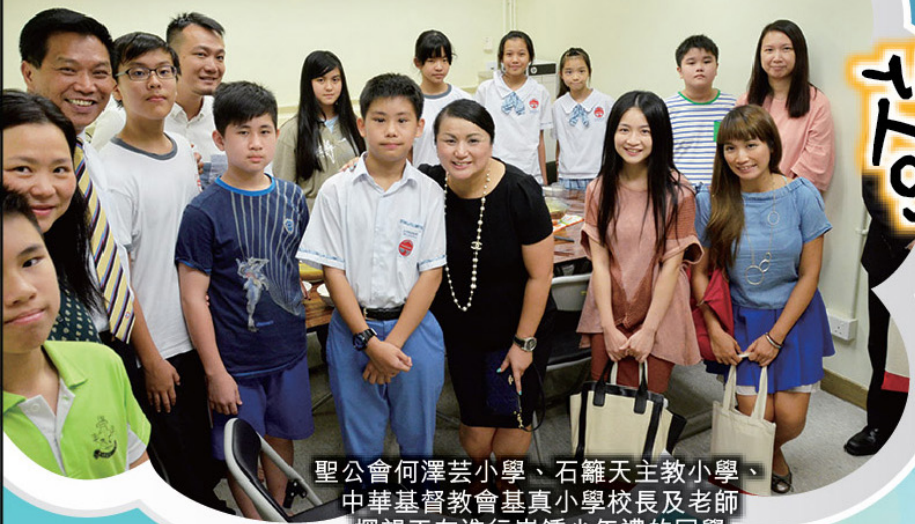
聖公會何澤芸小學、石籬天主教小學、中華基督教會基真小學校長及老師探望正在進行嶺鍾少年禮的同學