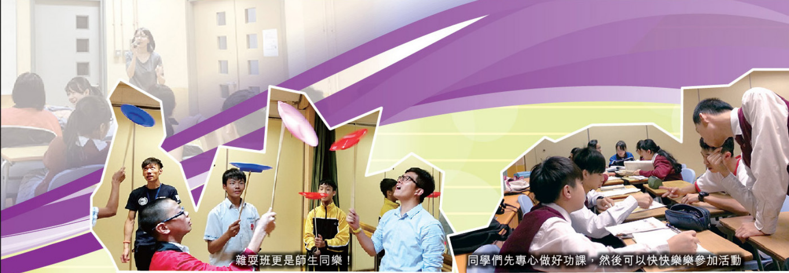
雜耍班更是師生同樂！