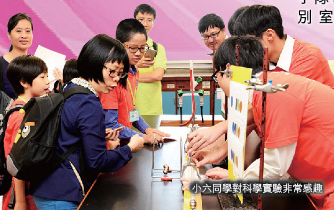
小六同學對科學實驗非常感興趣

區，期間導賞員除了會介紹嶺鍾中的校園生活點滴外，亦會講解各室或展區的特別之處。據當值樓層的老師及導賞員反映，參加的小六同學對中學的校園生活感到十分好奇，亦對嶺鍾中多元化的學習環境加以讚賞，認為是次參觀讓他們獲益良多。