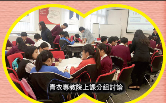
青衣專教院上課分組討論

為了讓同學親身體會專上學院的課堂情況，今年特別安排學生到「香港專業教育學院(青衣分校)」參觀，學生可透過課堂的參與，認識商業科目相關的課程。此外，又到「香港交易所」參觀，除了可見識香港證券投資市場的交易實況外，導賞員清晰的講解，有助學生對文憑試中「基礎個人理財」課程內容的理解。