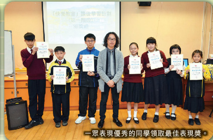
一眾表現優秀的同學領取最佳表現獎。