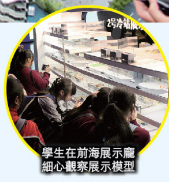
學生在前海展示廳細心觀察展示模型