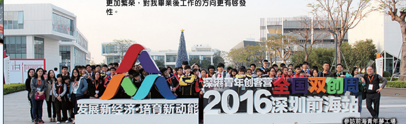
參訪前海青年夢工場