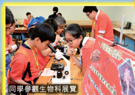
同學參觀生物科展覽