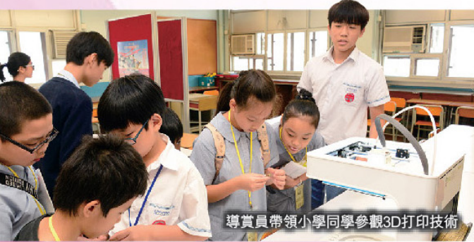
導賞員帶領小學同學參觀3D打印技術

兩天的小六模擬面試活動中，共有164名來自不同學校的小學生出席。他們被編作五人一組，主要以中文及英文模擬面試，秩序井然。各面試小學生均投入參與，認真準備，表現優秀。面試完畢，學生均細心聆聽面試老師的點評，汲取經驗。從聽取面試技