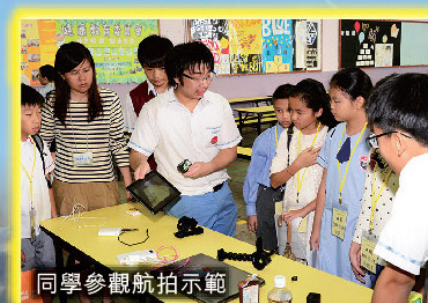
同學參觀航拍示範