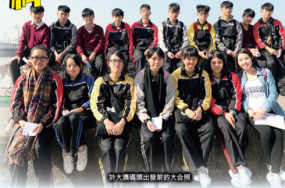
於大澳碼頭出發前的大合照

「我對棚屋的印象較深刻，它們反映了當地人以往靠水為生的居住面貌，我認為需要被保留，因為這些文物都記錄著當時本地人的生活環境，對我們學習香港歷史有更全面的幫助。」