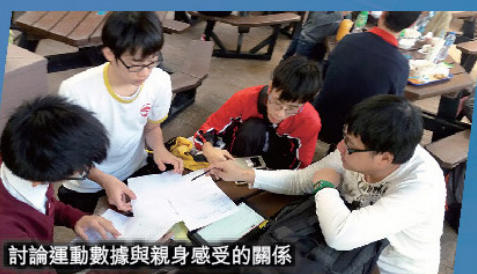
討論運動數據與親身感受的關係

● 總括而言，我認為這次物理科的專題研習日十分有趣，不但可以透過較輕鬆的方式學習和鞏固課本的知識，更可以透過與同學的交流加深與同學的友誼。