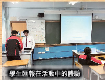
學生匯報在活動中的體驗