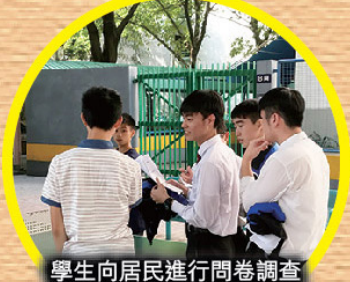
學生向居民進行問卷調查