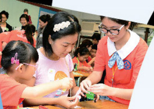
本校「科技大使」協助指導 參賽者製作風動力賽車

嶺鍾中師生籌備多時，同心協力舉辦此項大型盛事，旨在讓小學生們可以跳出課室，在製作「跑車」的過程中認識力學原理，從而應用於日常生活中，更重要的，是能促進親子合作，一起感受參與科技活動的樂趣。此項盛事獲得各界機構鼎力支持，包括11個協辦團體：香港科學創意學會、香港專業教育學院(青衣)、葵青區家長教師會聯會、聖類斯中學(小學部)、啟基學校、東華三院高可寧紀念小學、中華基督教會基慧小學家長教師會、中華傳道會許大同學校家長教師會、拔萃女小學家長教師會、聖公會何澤芸小學家長教師會以及東華三院周演森小學家長教師會。本校亦誠摯感謝三個贊助機構：兒童的科學、興迅實業有限公司及友堂堂的全力支持，致令活動舉辦得有聲有色、錦上添花。當天共有224個家庭、本校校董、校長、老師、學生科技大使、友校校長及校友聯同學生一起參與，比賽氣氛高漲，所有參與者均盡興而歸。除了製作「空氣動力跑車」，所有參與者亦隨學生大使參觀本校校園，前往不同特別室參與學科實驗以及觀賞不同展