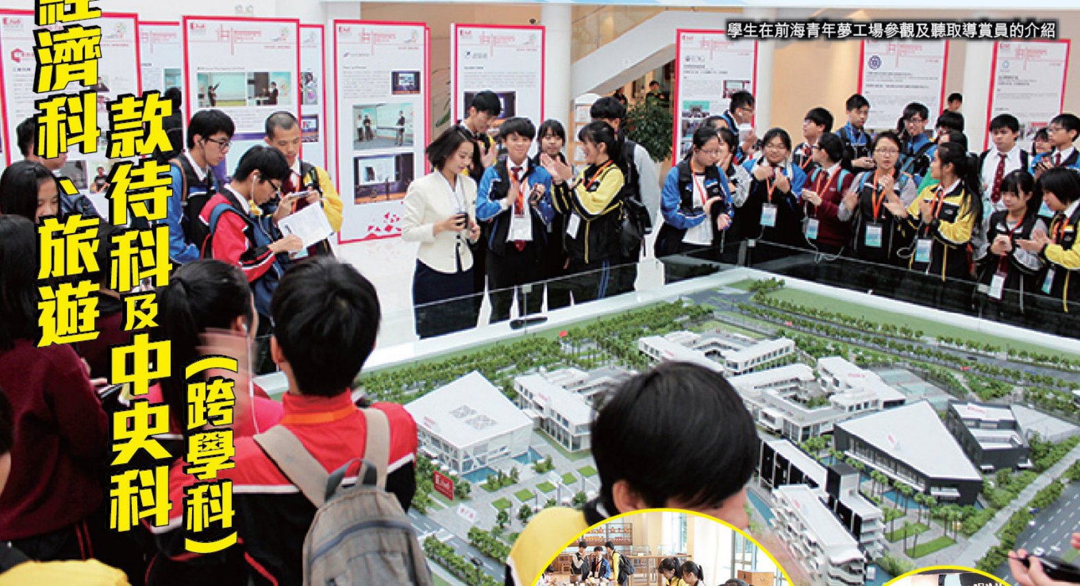
學生在前海青年夢工場參觀及聽取專員的介紹