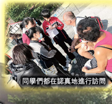
同學們都在認真地進行訪問