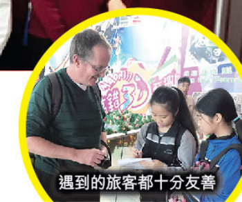
遇到的旅客都十分友善

今次專題研習日，對我日後的出路十分有幫助。在IVE的人力資源課程中，他們以遊戲方式來讓我們明白一間公司招聘新人的方法，非常生動有趣。另外，在參觀交易所的時候，他們講述交易所的歷史和運作情況，改變我對交易所的理解。今次參觀體驗，大大加深我對企財的認識。