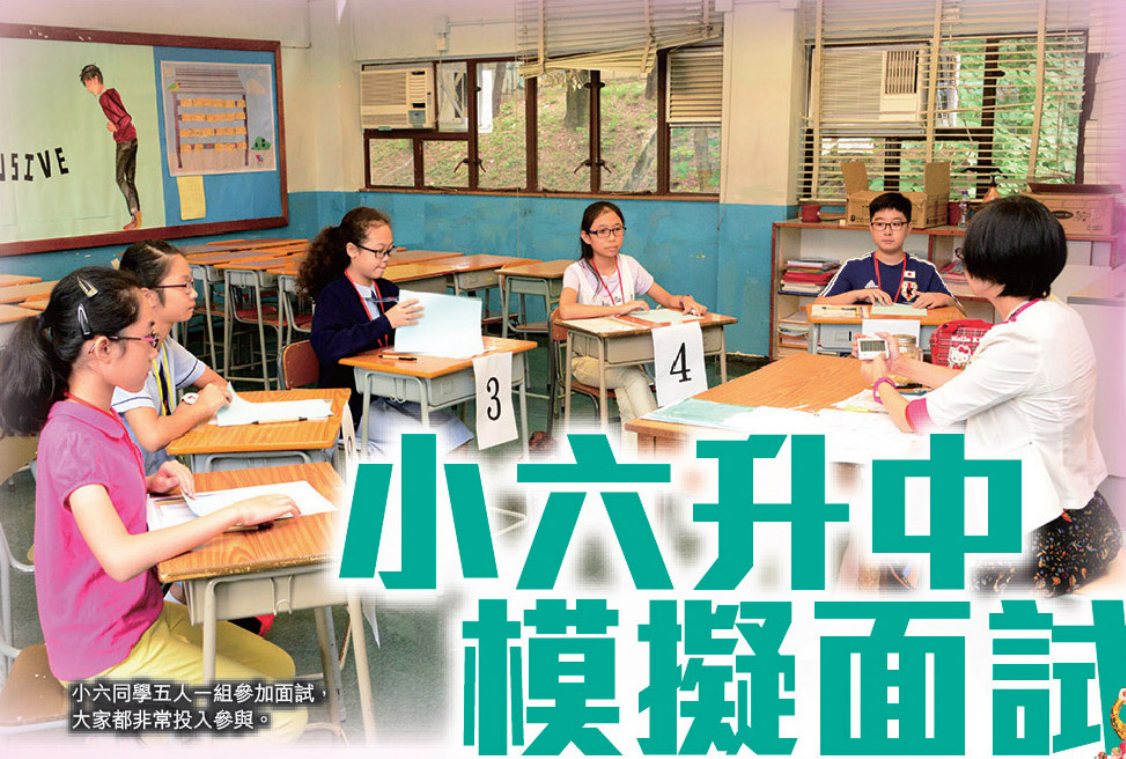
小六同學五人一組參加面試，大家都非常投入參與。