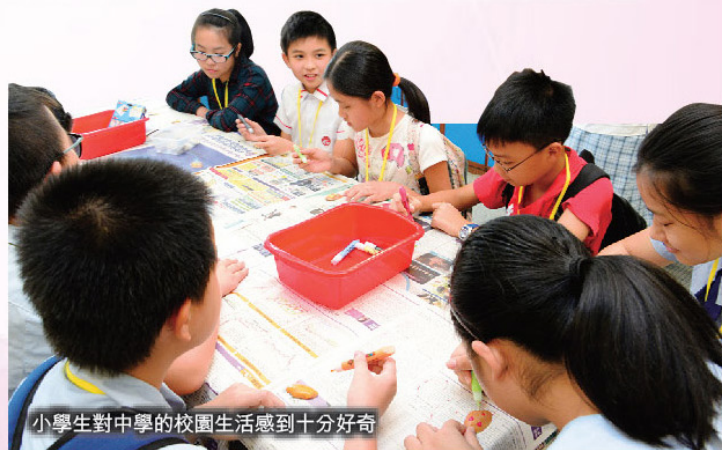
小學生對中學的校園生活感到十分好奇

巧，再作實踐體驗，最後老師分析錯漏，總結經驗，學生均感他們面試技巧的掌握更加熟練。校內參觀由本校學生當導賞員，帶領小六同學參觀校內的特別室及展覽區。特別室及展覽區共設五個，分別為物理實驗室、生物室實驗室、科技展覽室、健身室及航拍示範區。每兩至三位導賞員負責帶領一小隊參觀各特別室及展覽