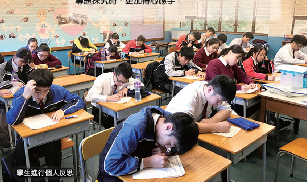
學生進行個人反思

原來表面上看似簡單的問卷都需要注重很多的細節。老師及其他組別同學的意見，使我們獲益良多，出外做問卷調查期間，我們必須要主動地去尋找調查對象，這些經驗對我們將來進行獨立專題探究時都很有幫助。